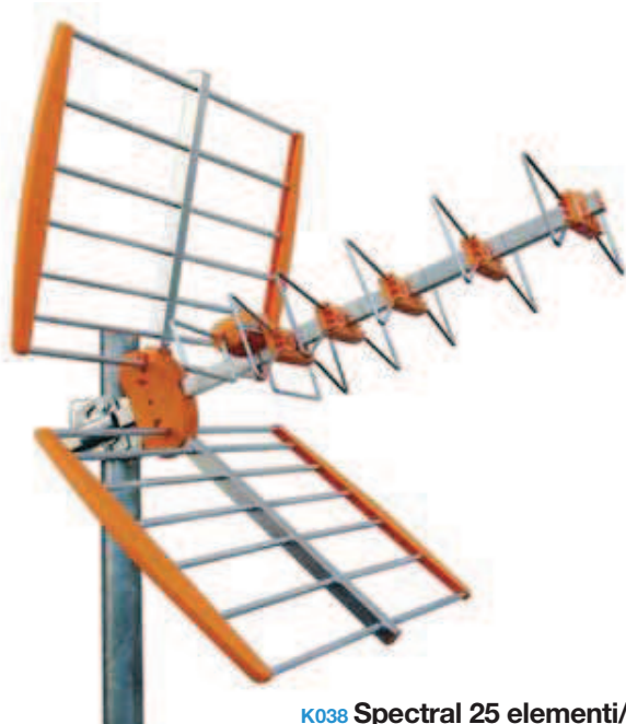
K038 Spectral 25 elementi/F